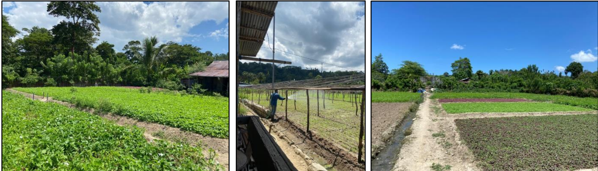
Gambar 2. Holtikultura Sayuran, Waihari Desa Suli

Hasil panen selama ini di pasarkan ke kota Ambon dan sekitarnya dengan cara dijual melalui tengkulak seharga Rp. 3.000/ikat sayuran. Harga sayur yang relatif rendah sehingga sangat mempengaruhi pendapatan petani. Petani selama ini hanya mengandalkan hasil dari perkebunan untuk kebutuhan rumah tangga tanpa adanya kegiatan ekonomi lainnya.