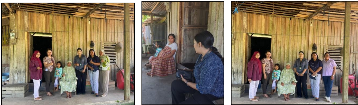
Gambar 3. Kegiatan Sosialisasi Diversifikasi Pendapatan

Diversifikasi pendapatan bagi petani sangat penting dalam menjaga ekonomi keluarga, sehingga terdapat beberapa alternatif pilihan diversifikasi pendapatan yang dapat dilakukan oleh petani di Wayari Desa Suli, diantaranya melakukan diversifikasi horizontal (beragam komoditas sayur), yaitu dengan menanam berbagai jenis sayur dengan waktu panen yang berbeda sekaligus sehingga dapat menjaga pendapatan petani. Tujuannya yaitu dapat mengurangi resiko gagal panen dan menstabilkan ekonomi rumah tangga petani. Hal ini sudah dilakukan oleh petani di Wayari Desa Suli dengan menanam berbagai macam jenis sayuran diantaranya bayam, bayam merah, kangkung, sawi, dan tomat.