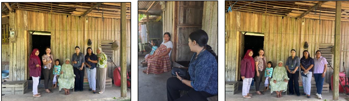
Gambar 3. Kegiatan Sosialisasi Diversifikasi Pendapatan

Diversifikasi pendapatan bagi petani sangat penting dalam menjaga ekonomi keluarga, sehingga terdapat beberapa alternatif pilihan diversifikasi pendapatan yang dapat dilakukan oleh petani di Wayari Desa Suli, diantaranya melakukan diversifikasi horizontal (beragam komoditas sayur), yaitu dengan menanam berbagai jenis sayur dengan waktu panen yang berbeda sekaligus sehingga dapat menjaga pendapatan petani. Tujuannya yaitu dapat mengurangi resiko gagal panen dan menstabilkan ekonomi rumah tangga petani. Hal ini sudah dilakukan oleh petani di Wayari Desa Suli dengan menanam berbagai macam jenis sayuran diantaranya bayam, bayam merah, kangkung, sawi, dan tomat.