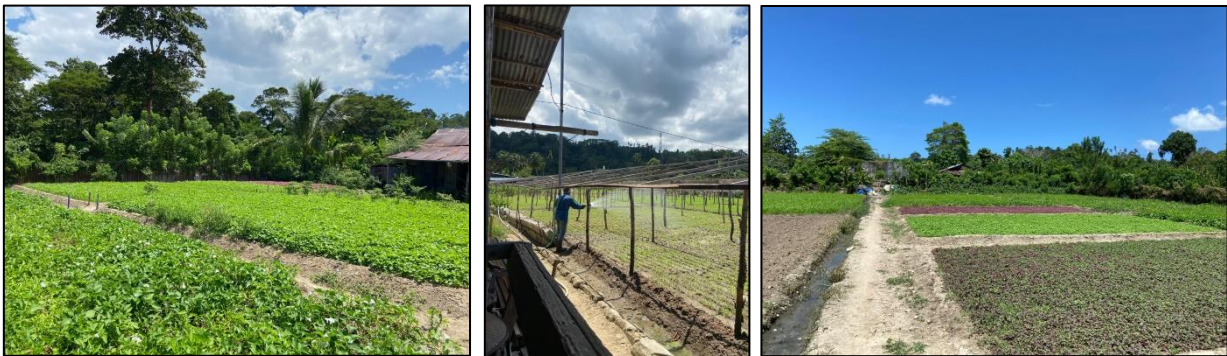
Gambar 2. Holtikultura Sayuran, Waihari Desa Suli

Hasil panen selama ini di pasarkan ke kota Ambon dan sekitarnya dengan cara dijual melalui tengkulak seharga Rp. 3.000/ikat sayuran. Harga sayur yang relatif rendah sehingga sangat mempengaruhi pendapatan petani. Petani selama ini hanya mengandalkan hasil dari perkebunan untuk kebutuhan rumah tangga tanpa adanya kegiatan ekonomi lainnya.